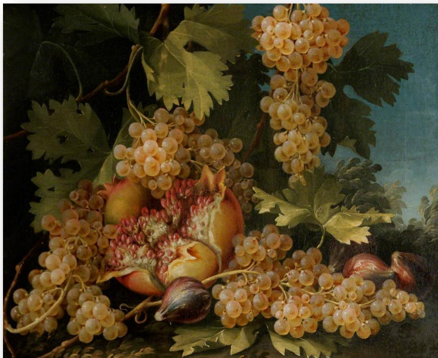
Still Life Study: Fruit Artist Anhysbys (17eg Ganrif) Amgueddfa Llandudno

Gadewch i ni feddwl am ba destunau sydd i’w gweld yn y paentiad yma, yn union fel y gwnaethom uchod. Yma, mae grawnwin ar winwydden iach yn amgylchynu pomgranad melyn llawn hadau sydd wedi byrstio. Wedi’u twcio o amgylch y grawnwin mae tair cneuen. Er eu bod dal yn gnau Ffrengig, yn hytrach na chael hadau’r cnau fel sydd gan Chardon, yma, mae ffrwythau aeddfed cnau Ffrengig. Mae hyn yn agosach o lawer at fod yn ddarluniad uniongyrchol o’r adnod o Ganiad Solomon.